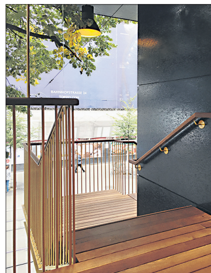
Eine Aufweitung dient als Balkon zur Bahnhofstrasse.

Diese Seite wurde realisiert von NZZ Media Solutions AG Stans