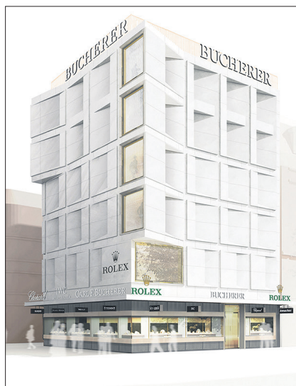
2018 präsentiert der Juwelier sein neues Kleid.

Der Juwelier lässt sich seinen Auftritt etwas kosten. Während der gesamten Bauzeit mietet Bucherer die Flächen, die sonst eine zuständige Plakatfirma bepflastern würde. Ein kluger und nötiger Entscheid, um an der lebendigen Bahnhofstrasse während des Umbaus wahrgenommen zu werden. Und so beweisen office haratori, dass auch ein Bauzaun Architektur ist. Ihr Provisorium inszeniert einen präzisen Weg, lässt Bauteile fliegen und meistert den Spagat von der OSB-Platte zum Robinien-Handlauf. Palle Petersen